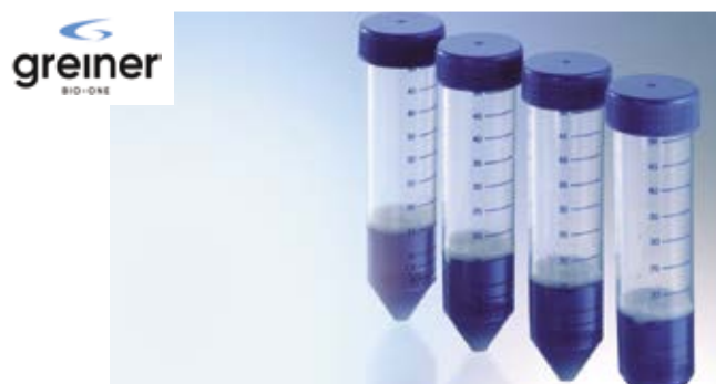
Enrichissement en cellules tumorales circulantes disséminées à partir de sang total.