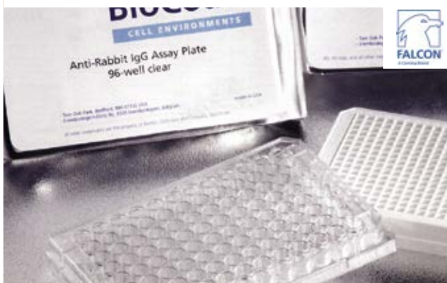
Plaques en polystyrène à fond plat.