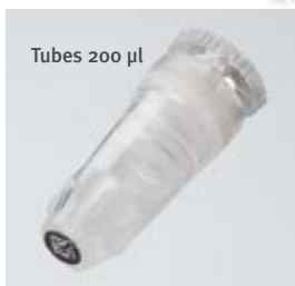
Tubes 200 µl