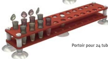
Portoir pour 24 tubes