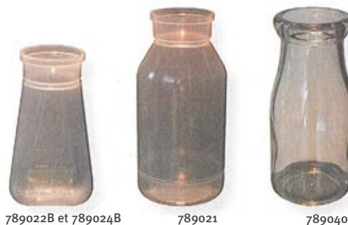
789022B et 789024B

* hauteur : 136 mm / ø base : 63 mm ø haut ext. : 55,5 mm / ø haut int. : 42 mm / ø haut intérieur collerette : 35,2 mm