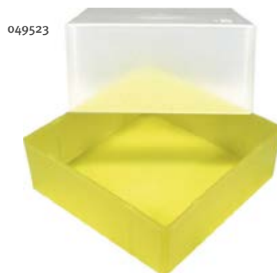
Exemple de boîtes + espaceurs en polypropylène