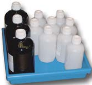
Bac de rétention en polypropylène