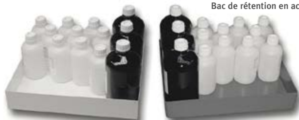
Bac de rétention en acier