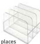
Rack 3 places